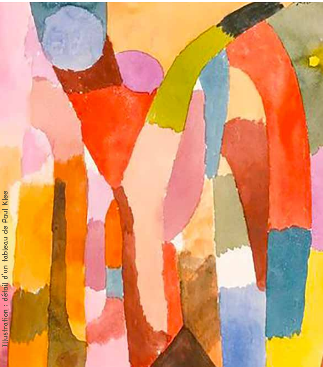
Illustration : détail d'un tableau de Paul Klee